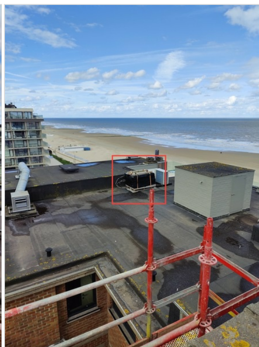
Leien staan reeds klaar