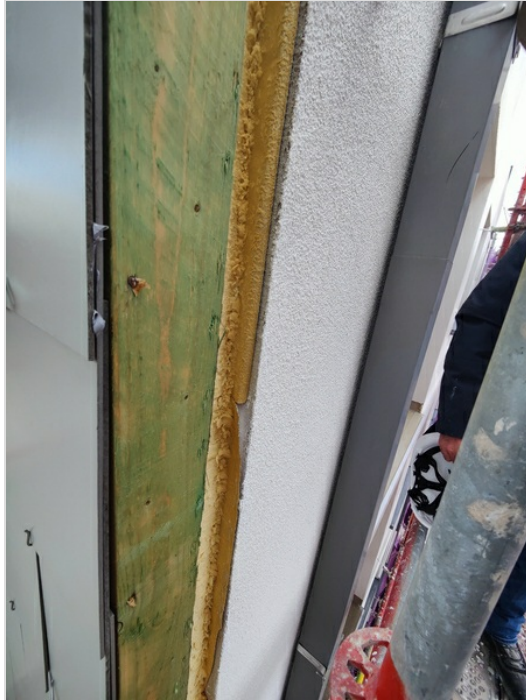
Zink profiel dient nog sluitend geplaatst te worden

Ifv de dakwerken wordt er gevraagd naar de planning van de resterende openstaande punten. Hierbij opmerkelijk dat gezien gunstige weer voorkeur werd gegeven de gevel leien te plaatsen maar het dakvlak verder niet afgewerkt werd.