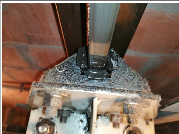
Leidsloffen kooi bovenkant.