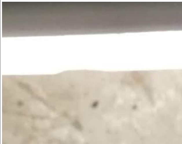
Als je zeer goed kijkt, zie je dat er een stuk uit de afschermkap gebroken is.