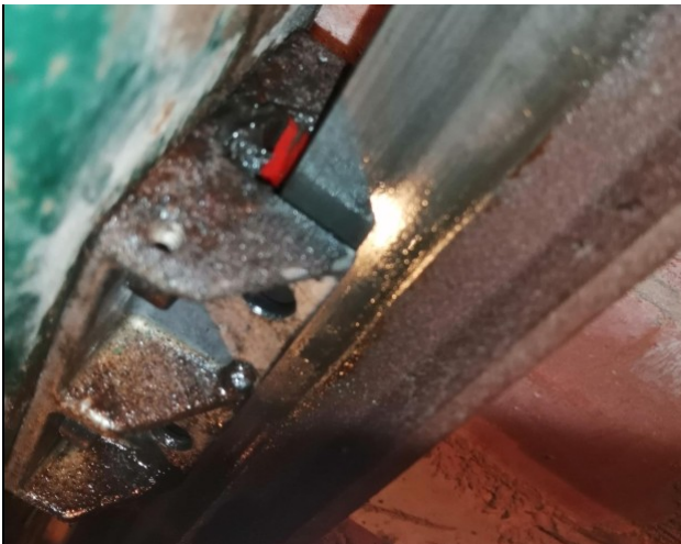
Leidslof tegengewicht: 2/3 is verdwenen.