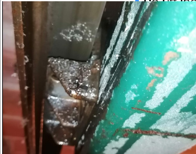
Leidslof tegengewicht: alle kunststof glijvoering is weg.