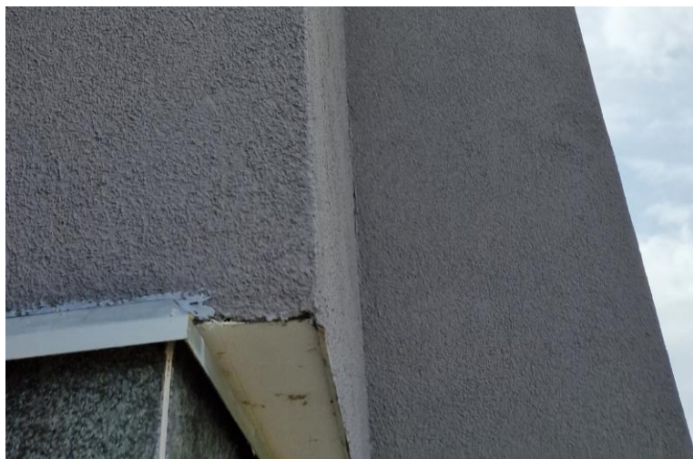
Startprofiel + afdruiplijst geplaatst