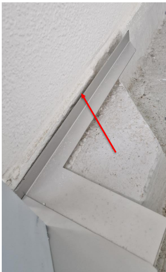
Kopschotten op te kitten voor plaatsing afdekkap