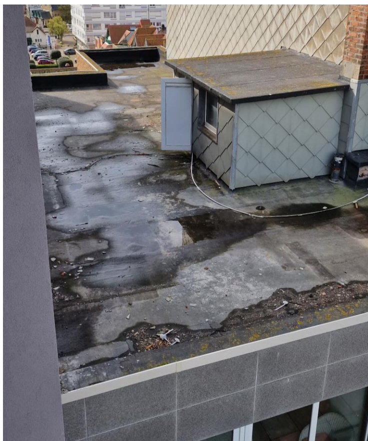
Dak aanpalend gebouw te reinigen

Eerder gemaakte opmerkingen door de aannemer te bevestigen dat ze uitgevoerd of aangepast werden.