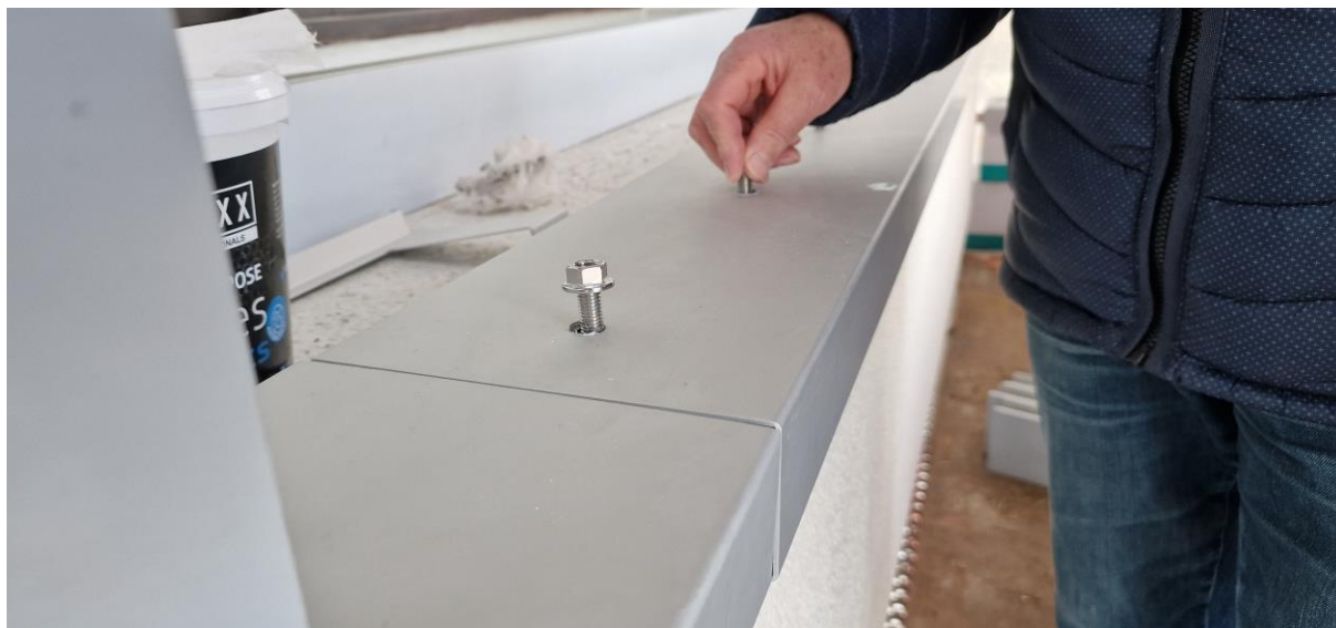
Voor plaatsing afdekkap de draadstangen nog aanwerken met vloeibare dichting

Eerder gemaakte opmerkingen door de aannemer te bevestigen dat ze uitgevoerd of aangepast werden.