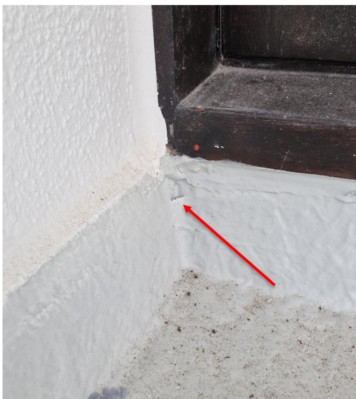
Nazicht (alle verdiepingen) waterdichting voor de volgende fase uit te voeren!

Eerder gemaakte opmerkingen door de aannemer te bevestigen dat ze uitgevoerd of aangepast werden.