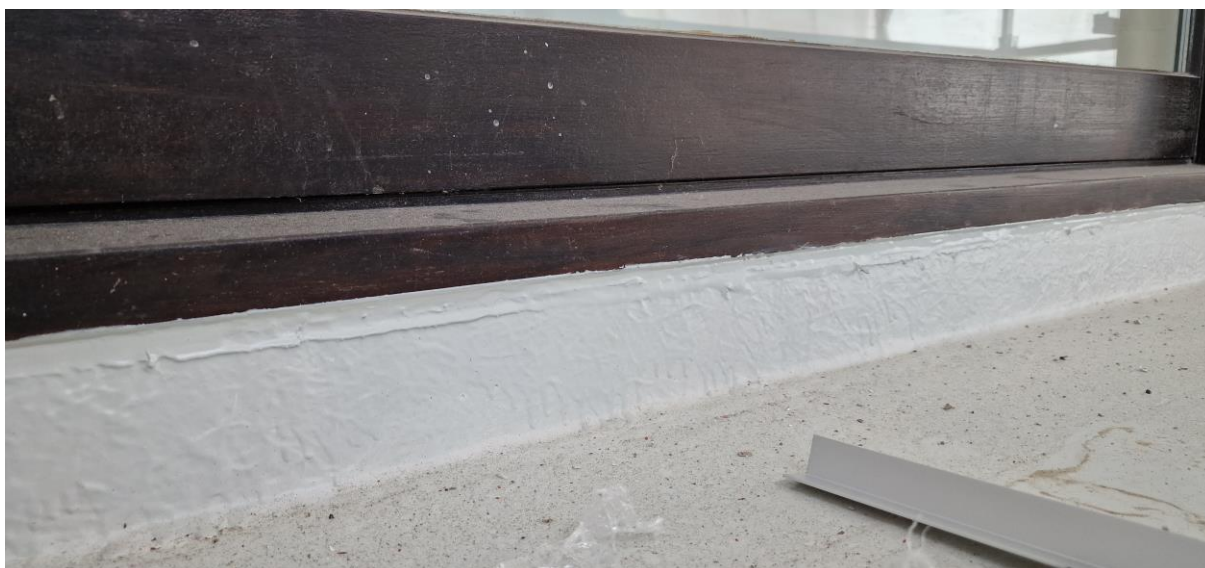
Te reinigen raamprofielen

Eerder gemaakte opmerkingen door de aannemer te bevestigen dat ze uitgevoerd of aangepast werden.