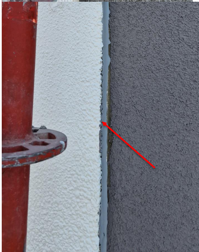
Kitwerk bij te werken aansluiting ETICS – voorgevel

Eerder gemaakte opmerkingen door de aannemer te bevestigen dat ze uitgevoerd of aangepast werden.