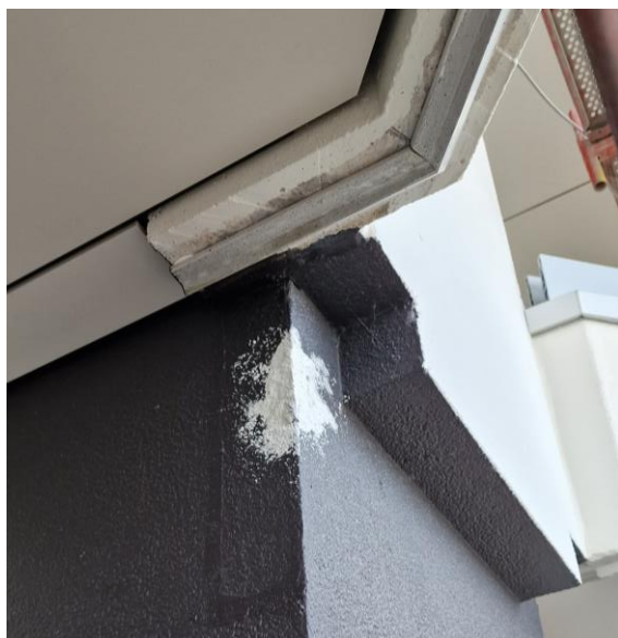
Thv. inkom nog bij te schilderen

Eerder gemaakte opmerkingen door de aannemer te bevestigen dat ze uitgevoerd of aangepast werden.