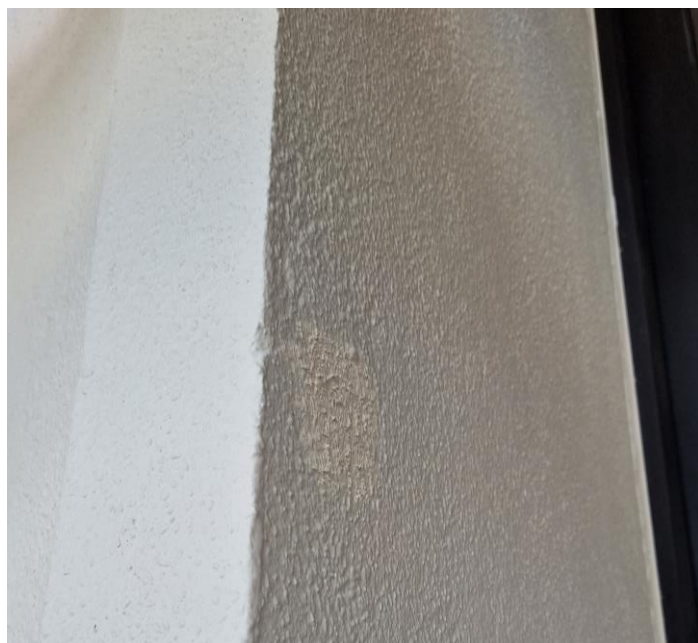
Voorbeeld van retouche oude verankering – nog te schilderen