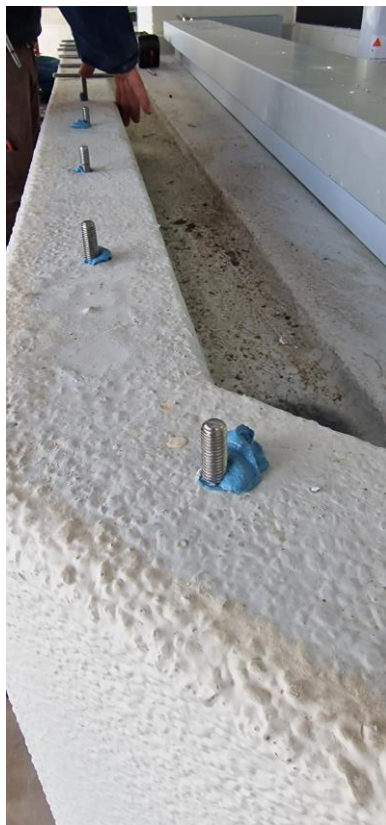
Correct uitgevoerde chemische verankering