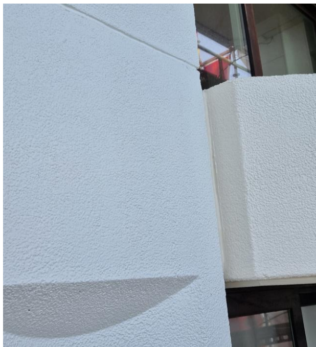
Aflijning correct uitgevoerd