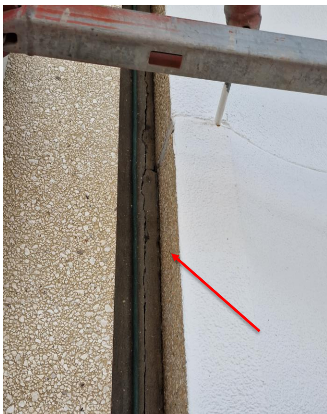
Retour gevel nog te schilderen

Eerder gemaakte opmerkingen door de aannemer te bevestigen dat ze uitgevoerd of aangepast werden.